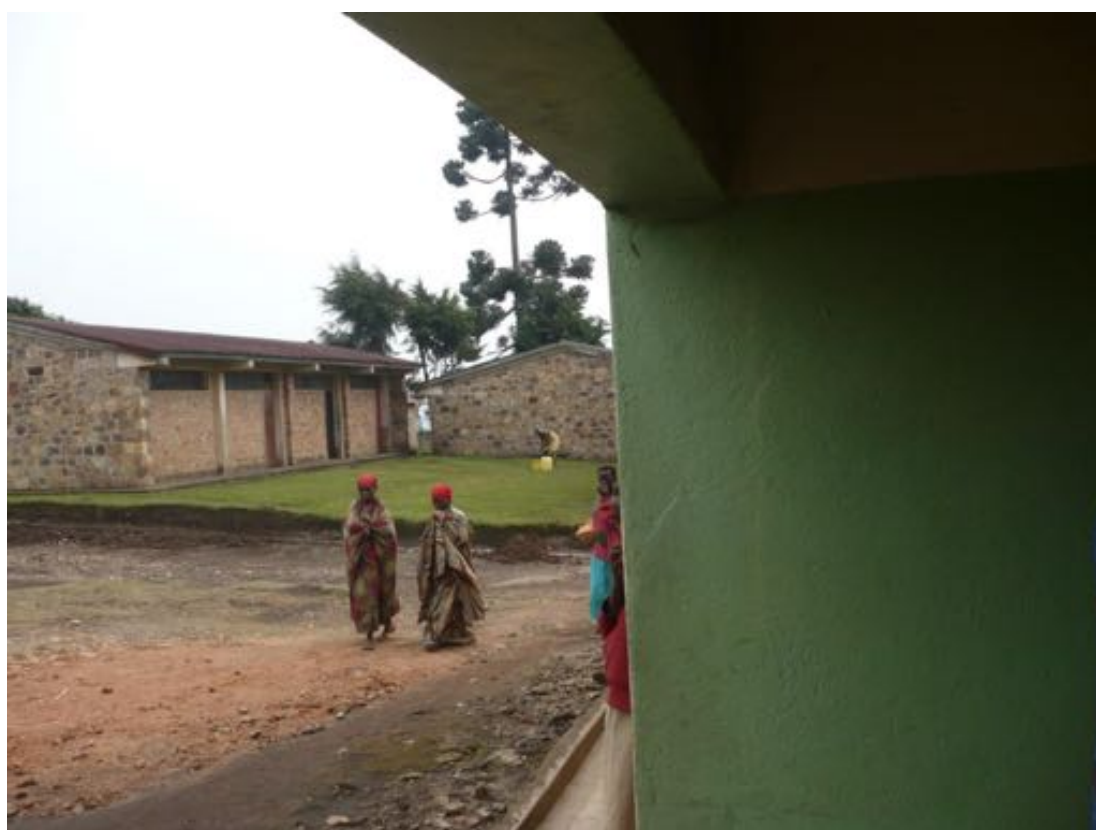
Reparto maternità: approvvigionamento idrico manuale