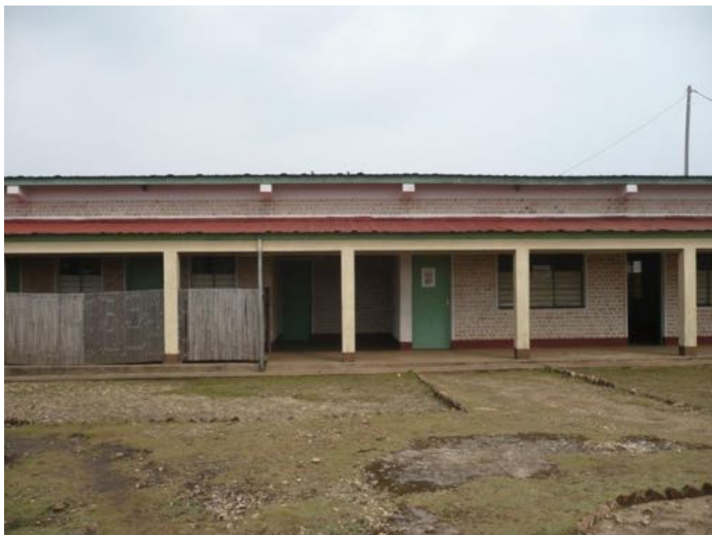
Presidio ospedaliero: reparto maternità