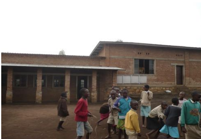
Scuola primaria di Ryarusera